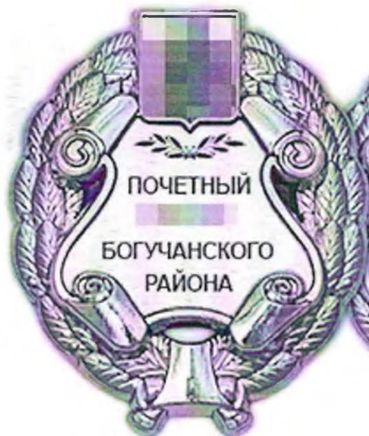
Знак «ПОД ЗОЛОТО»

На знаке изображен Герб Богучанского района