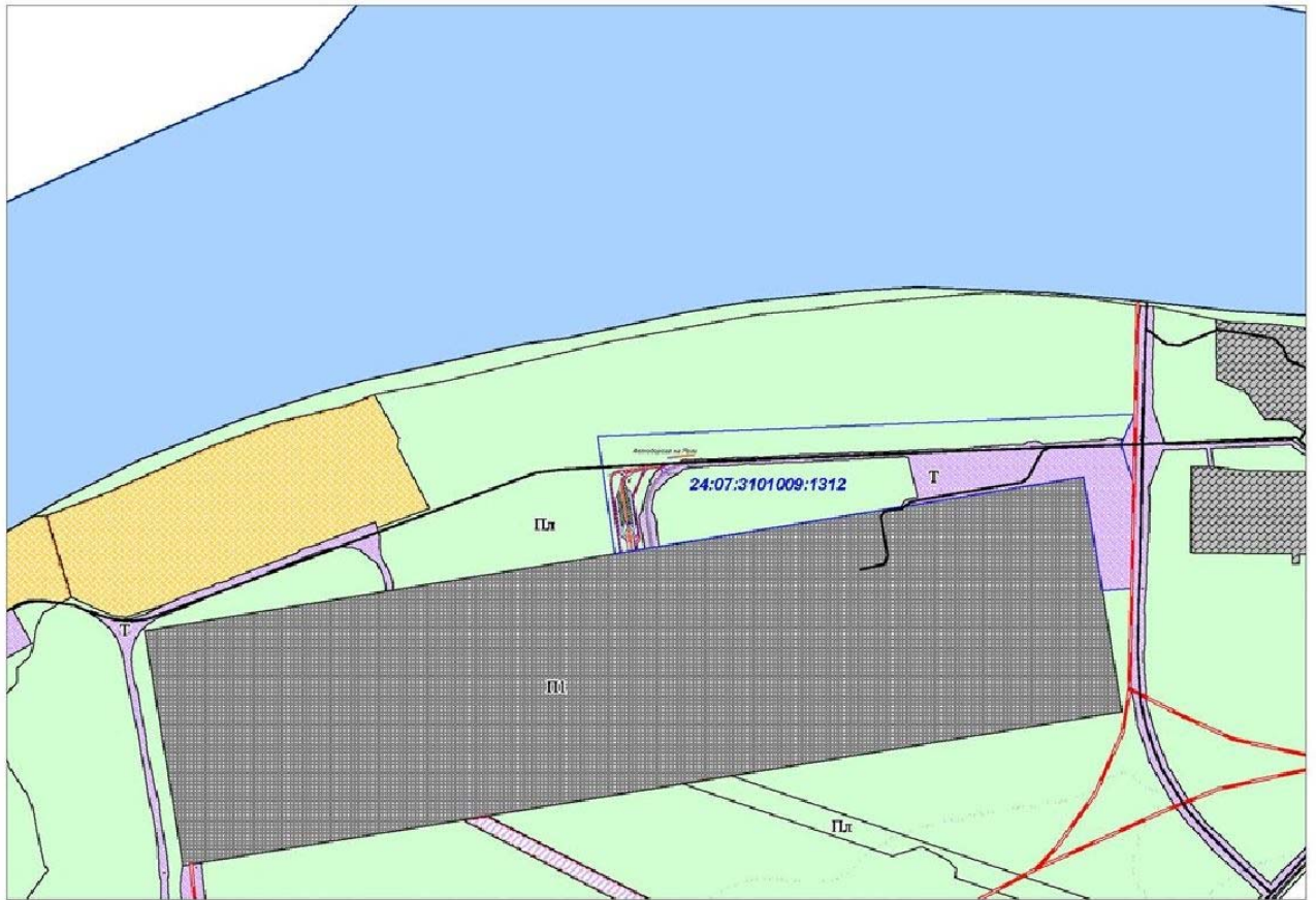
Изображение №1 Фрагмент существующей карты градостроительного зонирования